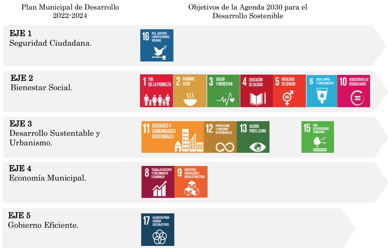
Figura 3: Alineación del Plan Municipal de Desarrollo 2022-2024 con los Objetivos de la Agenda 2030 para el Desarrollo Sostenible

Por lo anterior, con la formulación del Plan Municipal de Desarrollo 2022-2024 se busca contribuir específicamente y desde el ámbito de competencia municipal, en los siguientes objetivos y metas de la Agenda 2030 para el Desarrollo Sostenible: