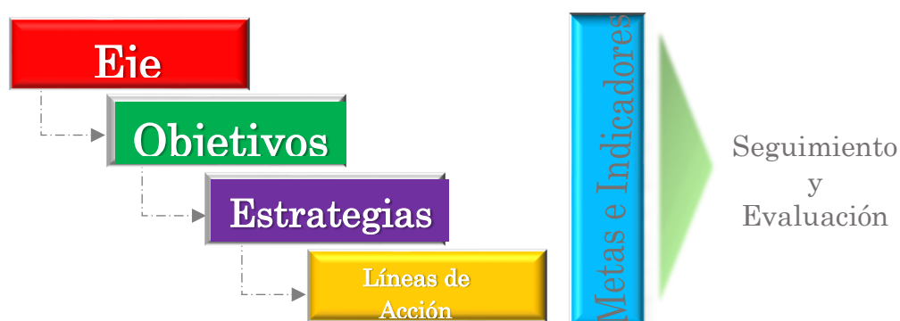
Figura 2: Ruta de construcción del Plan Municipal 2022-2024

A partir de cada eje rector, se definieron los objetivos, estrategias y líneas de acción del Plan Municipal de Desarrollo; por lo anterior, para alcanzar los objetivos planteados, se definieron las metas e indicadores que servirán para evaluar el avance respecto a lo planeado y que permitirán que la aplicación de los recursos públicos vaya acompañada de indicadores estratégicos y de gestión, así como de evaluaciones periódicas en materia de gasto público y fiscalización.