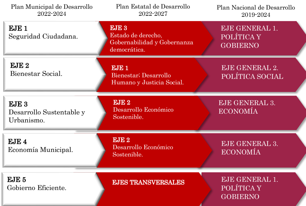
Figura 5: Alineación del Plan Municipal de Desarrollo 2022-2024 con los objetivos del Plan Estatal de Desarrollo 2022-2027 y con el Plan Nacional de Desarrollo 2018-2024

Por lo anterior, con la formulación del Plan Municipal de Desarrollo 2022-2024 se busca contribuir específicamente y desde el ámbito de competencia municipal, en los ejes, objetivos, estrategias y líneas de acción del Plan Estatal de Desarrollo en el Estado de Guerrero, cuando en términos de la Ley Número 994 de Planeación del Estado Libre y Soberano de Guerrero , se encuentre vigente.